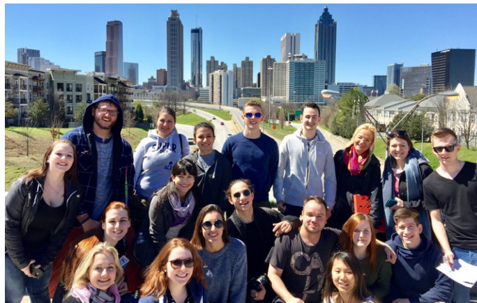
▲ Azubis vor der Skyline Atlantas